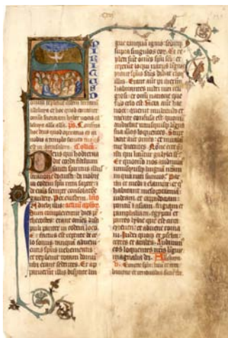
Seite aus einem alten Evangelienbuch

Da Gottesdienst und Gebet die Hauptaufgabe der Stiftsfrauen war, wurde auch der Tagesablauf von Gebetsstunden bestimmt. Im Stundengebet oder Chorgebet wurden Auszüge aus dem Alten und Neuen Testament der Bibel gelesen. Auch sangen die Frauen geistliche Lieder wie Psalmen und Hymnen oder Fürbitten. Täglich feierten sie mit einem Priester die Hl. Messe. Beim Chorgebet und bei der Messe saßen die Stiftsfrauen in Essen auf einer besondere Empore in der Kirche. Diese nannte man auch „Damenchor“ oder „Gräfinnenchor“, weil die Frauen alle adlig waren.