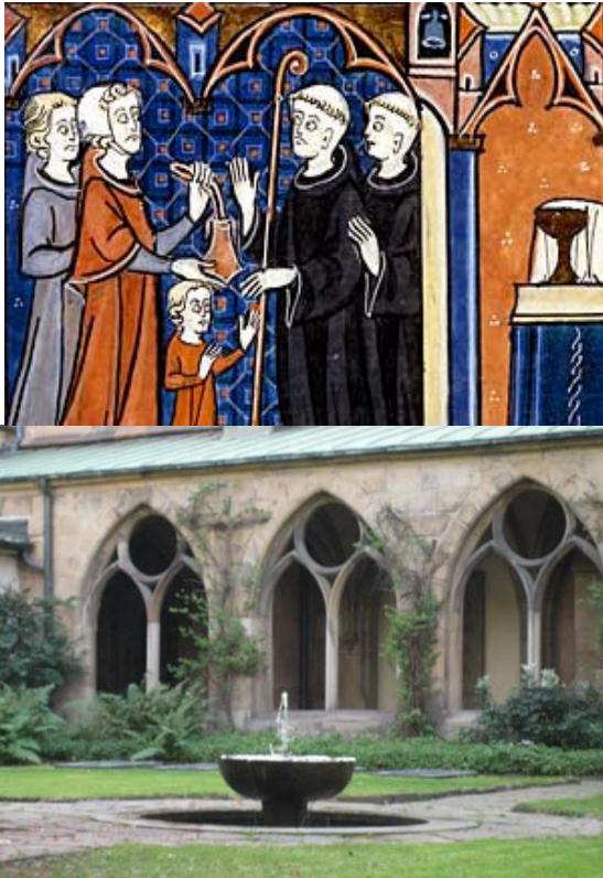
Ein Kind wird ins Kloster geschickt – Der Kreuzgang des Essener Doms

„Du sollst den Herrn, deinen Gott, lieben und deinen Nächsten wie dich selbst.“